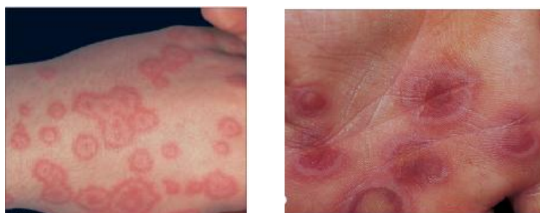
Ảnh 1. Hình bia bắn điển hình

Thương tổn đặc trưng của hồng ban đa dạng là hình bia bắn điển hình. Đó là những thương tổn hình tròn, đường kính dưới 3 cm, ranh giới rõ với da lành, được tạo nên bởi ít nhất 3 vòng tròn đồng tâm, hai vòng ngoài có màu sắc khác nhau bao quanh một tâm ở giữa sẫm màu (là nơi có sự phá hủy của thượng bì để hình thành nên một mụn nước hoặc vảy tiết).