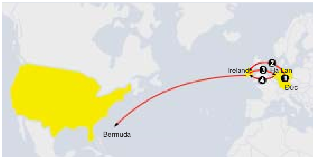
Hình 2: Chiến lược Sandwich Hà Lan với mô hình hai công ty Ireland

Lợi dụng luật thuế tại Ireland chỉ đánh thuế thu nhập công ty đóng tại Ireland chứ không đánh thuế công ty Ireland được thành lập tại các nước khác. Nên công ty Ireland đầu tiên hoạt động tại thiên đường thuế như Bermuda, công ty này bán quyền cho công ty Ireland thứ hai có trụ sở tại Ireland có nhiệm vụ thu tất cả các thu nhập từ bản quyền và phí từ các nước, sau đó trả các khoản thu này cho công ty Ireland đầu tiên và được khấu trừ trước khi đánh thuế 12,5% tại Ireland. Cách tổ chức mô hình này tránh được việc phải chịu kiểm soát thu nhập chịu thuế tại Mỹ của các công ty như Apple hay Google.