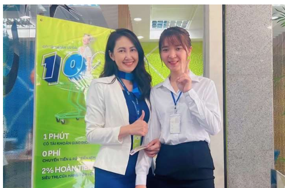
Mentor đồng hành giàu kinh nghiệm