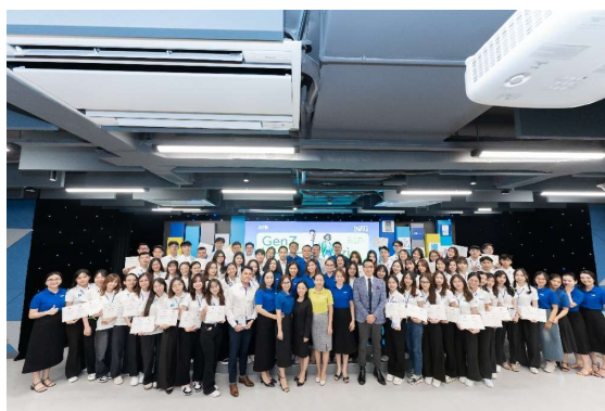
Hoạt động gắn kết đa dạng