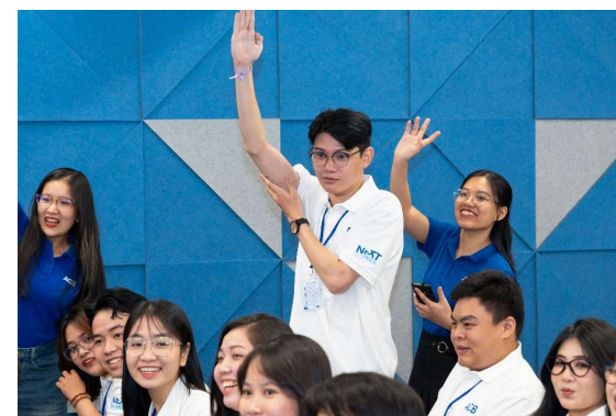
Chương trình thi đua dành riêng cho TNB